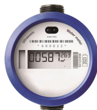
Voorbeeld van een digitale watermeter

Om te komen tot deze grootschalige vervangingsoperatie is water-link niet over één nacht ijs gegaan. De digitale watermeter werd uitvoerig getest in een pilootproject bij 1.000 proefpersonen. Zij reageerden alvast enthousiast.